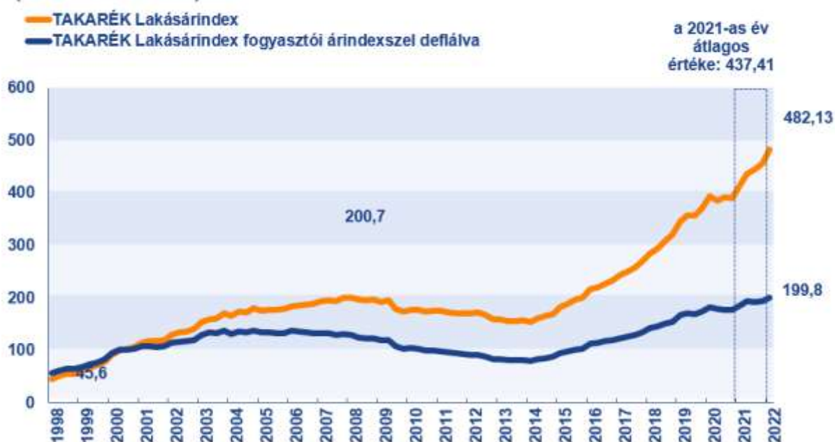
1. ábra. A TAKARÉK Lakásárindex alakulása