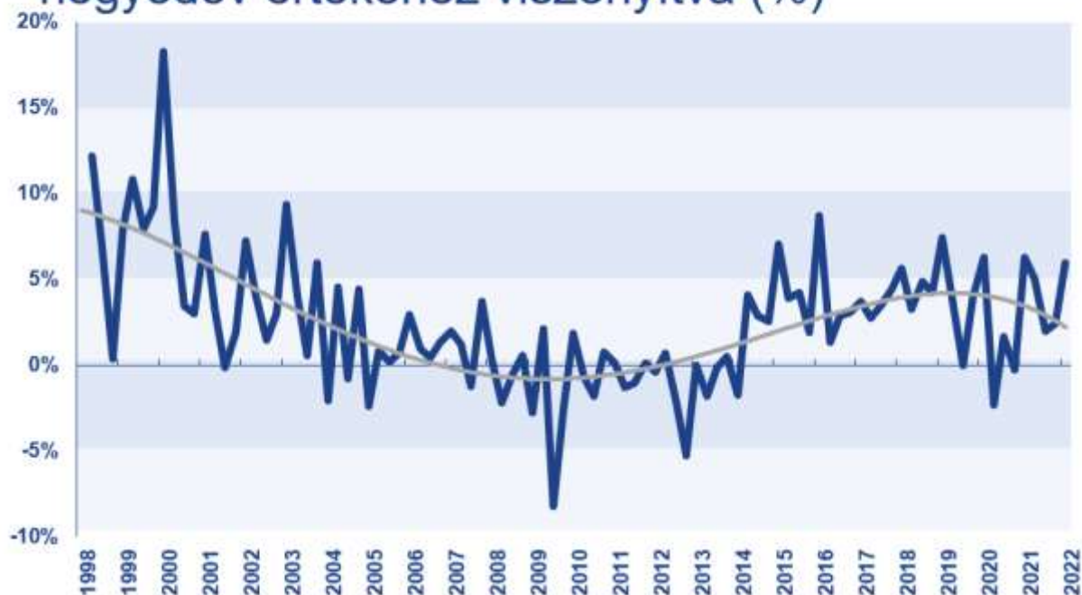
2. ábra. A TAKARÉK Lakásárindex változása az előző negyedévhez képest