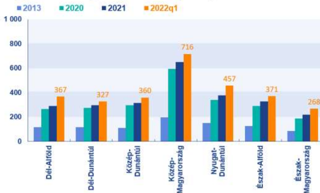
3. ábra. A medián fajlagos lakások Magyarországi régióiban (ezer Ft/m 2 ) (Forrás: Takarék Index )

Település típusok szerint is nagyobb különbségek voltak jellemzőek. A fajlagos medián árak a megyeszékhelyeken 14,59 százalékkal, a városokban pedig 13,21 százalékkal emelkedtek 2022 első negyedévére 2021-hez képest. Ugyanakkor a községek esetében inkább mérséklődött (-1,98%) az ingatlanokért négyzetméterenként fizetett összeg. Budapesten a fajlagos medián árak változása 8,96 százalékos volt 2022 első negyedéve és 2021 között.